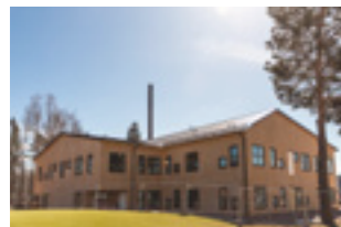
Rågen | Blåkullen 4

Under våren invigdes Gamla Byn AB:s största investeringsprojekt på många år då 71 nybyggdhyreslägenheter, varav 31 trygghetsbostäder samt en gemensamhetslokal och verksamhetslokaler stod klart i centrala Avesta. Bolaget har därmed försett bostads- och lokalmarknaden i Avesta med nya, attraktiva lägenheter och verksamhetslokaler.