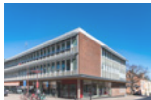
Siken | Kungsgatan

Andra stora investeringsprojekt under året är nybyggnation av en förskola på Rågen som har kapacitet att ta emot 122-160 barn. Första spadtaget togs under våren och projektet har fortlöpt bra under året. Förskolan beräknas vara inflyttningsklar sommaren 2023.