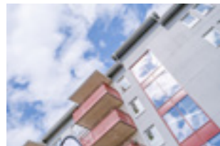
Boken | Fredsgatan